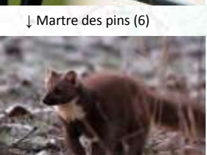
↓ Martre des pins (6)