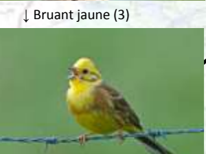
↓ Bruant jaune (3)