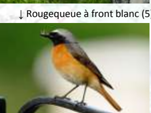
↓ Rougequeue à front blanc (5)