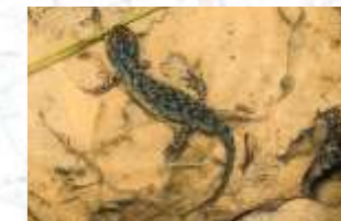
↑ Triton alpestre (14)