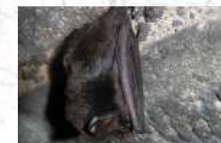
↑ Barbastelle d'Europe (13)