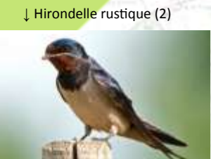
↓ Hirondelle rustique (2)