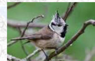
↑ Mésange huppée (11)