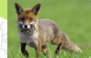
↑ Renard roux (9)

Le cours d'eau traversant la commune est riche en faune et flore. Lors de l'étude, un piège photographique a été mis en place, au-dessus d'une passerelle enjambant le cours d'eau, sur le site du Conservatoire des Espaces Naturels de Bourgogne, proche du lieu dit Les Proux . De nombreuses espèces ont pu être observées comme, le Renard roux (9) , le Blaireau européen , le Héron cendré ou encore le Canard colvert .