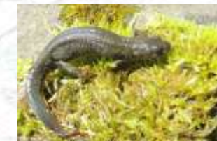
↑ Triton crêté (15)