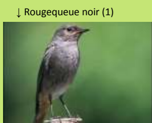
↓ Rougequeue noir (1)