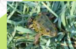
↑ Grenouille de Lessona (16)