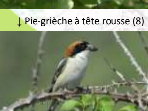
↓ Pie-grièche à tête rousse (8)