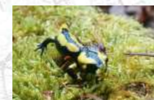
↑ Salamandre tachetée (12)