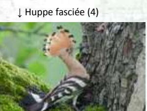
↓ Huppe fasciée (4)