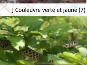
↓ Couleuvre verte et jaune (7)