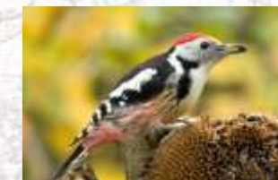
↑ Pic mar (10)