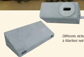
Différents nichoirs à Martinet noir.

On peut aussi poser des nichoirs en façade, en bordure de toit ou sous les avancées de toit à une hauteur minimale de 5 m.